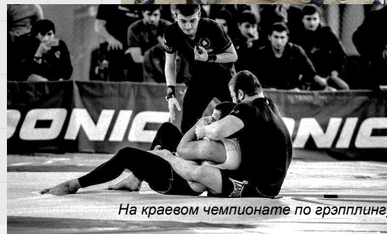
На краевом чемпионате по грэпплингу