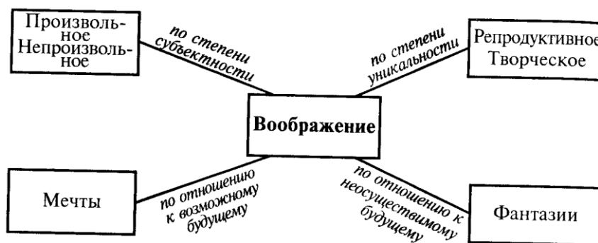
Рис. 2. Виды воображения

При непроизвольном воображении новые образы возникают под воздействием малоосознанных или неосознанных потребностей, влечений, установок. Такое воображение работает, как правило, тогда, когда человек спит, находится в дремотном состоянии, в грезах, в состоянии «бездумного» отдыха и т.п.