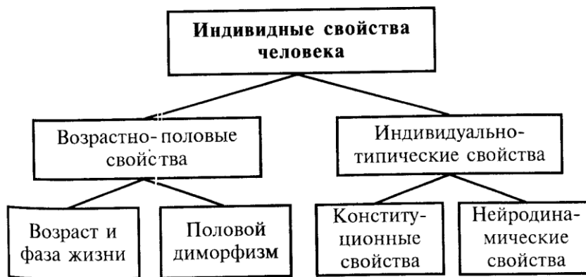
Рис.3. Индивидуальные свойства человека (по Б.Г. Ананьеву)

Классификация природных свойств человека наиболее полно описана Б.Г.Ананьевым. Индивидуальные свойства подразделяются им на два широких класса: класс возрастно-половых свойств и класс индивидуально-типических свойств. В свою очередь, индивидуально-типические свойства разделяются на конституционные и нейродинамические свойства (рис.17). Возрастные, половые, конституционные и нейродинамические свойства Б.Г.Ананьева называл первичными индивидуальными свойствами. Взаимосвязи между ними определяют более сложные образования индивида: структуру органических потребностей и сенсомоторную организацию . Совокупность важнейших свойств индивида и их сложных образований выступает в наиболее интегративной форме в виде темперамента и задатков .